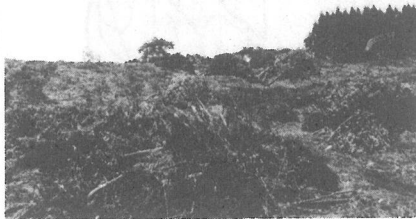
伐採の始まった工業団地予定地