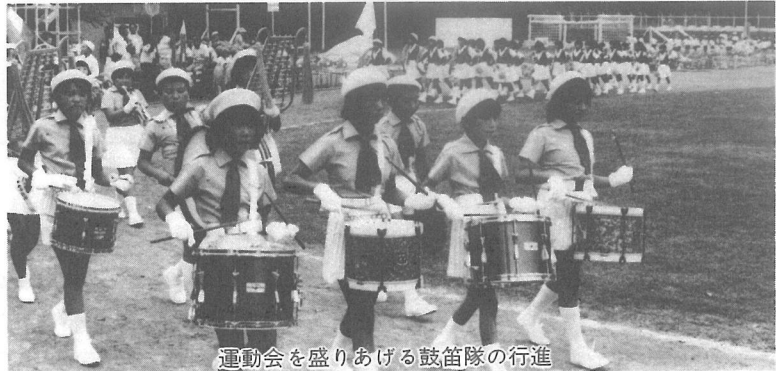
運動会を盛り上げる鼓笛隊の行進