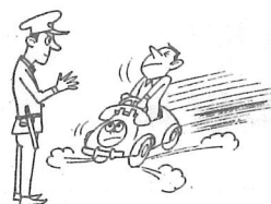
ダイヤルはメモを見ながら確かめて。