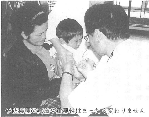
予防接種の意識や重要性はまったく変わりません