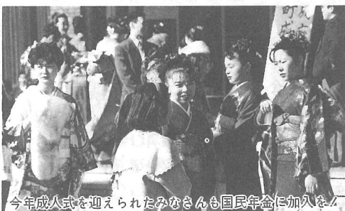
今年成人式を迎えられたみなさんも国民年金に加入を