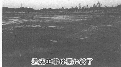
造成工事は概ね終了

答 ①スポーツ広場は平成6年度までに野球場やテニスコート、管理棟を整備し、さらに陸上競技場やゲートボール場などを2期工事として平成8年度までに完成させる予定で平成4年度から事業に着手している。