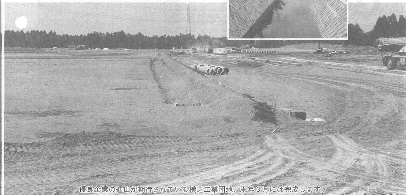
優良企業の進出が期待されている横芝工業団地、来年3月には完成します。