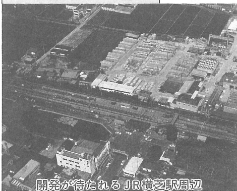
開発が待たれる JR横芝駅周辺

事業費 7億6500万円 事業概要 ①基本設計②用地取得(国鉄清算事業団用地)ほか