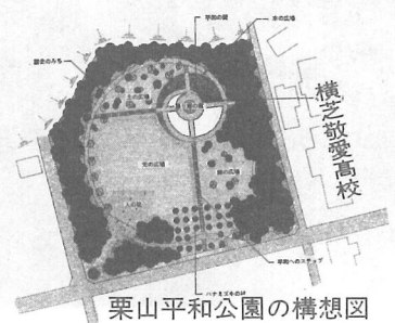
栗山平和公園の構想図

敬愛高校北側に建設するこの公園は、かつてこの地域に、旧陸軍飛行場があったことから、町の歴史を通じて平和の尊さを伝えるための公園として、また、美しい空間構成の中で、遊びや、くつろぎ、イベントなどの場として整備されます。