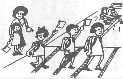
車がとまってから横断を