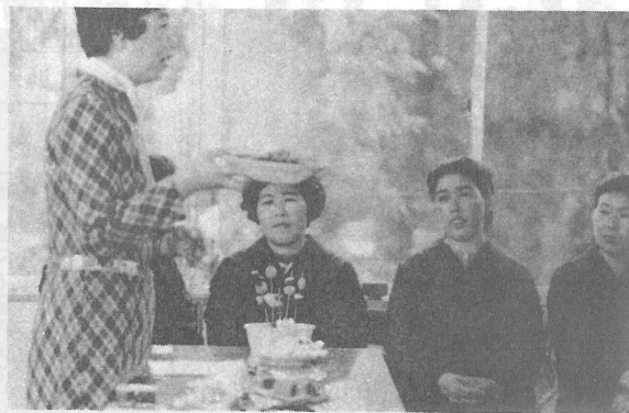
栄養師さんの説明に聞かせる会員のみなさん