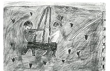
『えんそくの思い出』

※光のスポー ツ こうえんのタ イヤブラン コ であそびまし た。たのしか ったです。