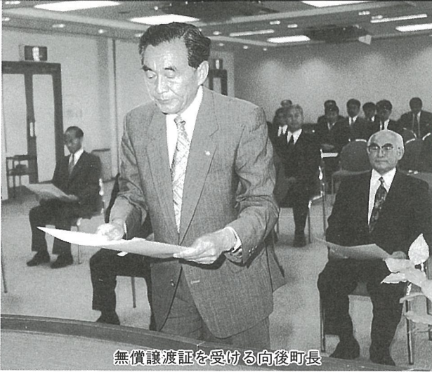
無償譲渡証を受ける向後町長